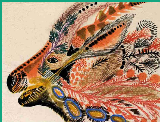
右：小林万里子「沈黙の対話」2012 左：七瀬綾乃「rainbows edge XXI」2025