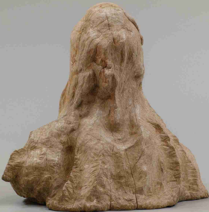
七瀬綾乃「rainbows edge XX - 石の舌 -」2025